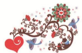
Kinpro 「flower x bear」 限定ジークレー* 8,400円