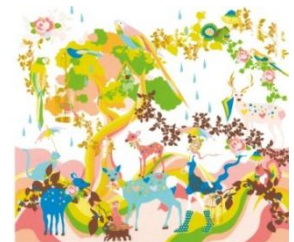
ホラグチカヨ 「sweet rain」 限定ジークレー* 8,400円