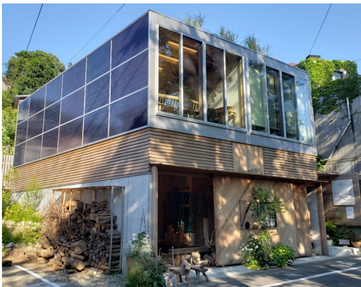
建物の壁材の代わりとして、トリナ・ソーラーの両面ガラスモジュール「DUOMAX」を使用