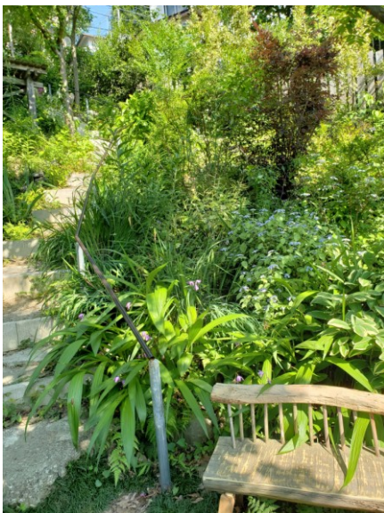
山野草やあじさい等が咲く「森の小道」

落葉樹で仕切られたガーデン・ルームズ方式のナチュラルガーデン「季(とき)の庭」は、「ローズガーデン」、草原や野原の雰囲気 연출した「メドウガーデン」、山野草やあじさい等が咲く「森の小道」の3つのテーマがあり、150株のバラのほか、デルフィニウムやジキタリスなど800種類の花が育てられています。敷地内には、ドッグサロン「アトリエ・ノル」や、かご編み教室、木工教室、ドライフラワー教室等様々な講座が開催される多目的コミュニティスペースがあり、地域住民の癒しの場となっています。