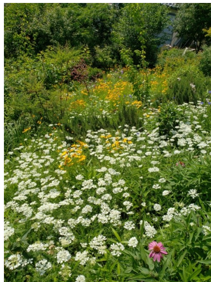
草原や野原の雰囲気を演出した「メドウガーデン」