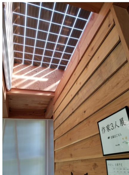
日中は柔らかい光が差し込みます