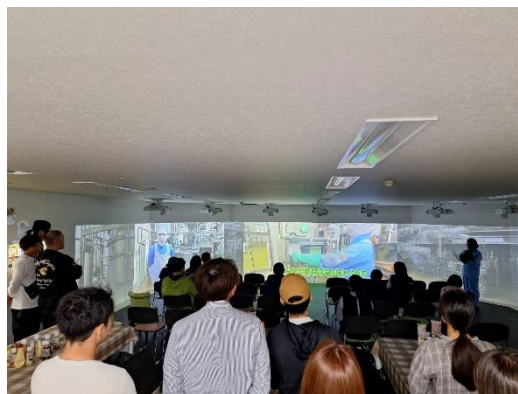
「スクリーンT」見学の様子