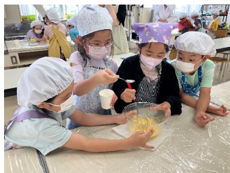
「マヨネーズ教室」の様子

社内認定講師「マヨスター※」が小学校を訪問し、食の楽しさと大切さを伝えることを目的に実施している出前授業「マヨネーズ教室」は 2002 年より開始し、リピーターとなって繰り返し開催する学校も増えてきました。2024 年度は全国 99 校の小学校で実施し、4,734 人の小学生が参加しました。