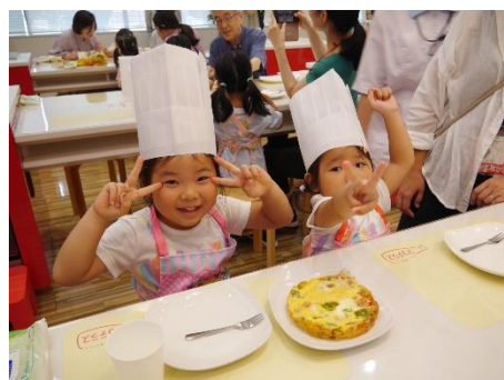
「ピーマンチャレンジ！」の様子

マヨテラスでは、「子どもたちが笑顔でピーマンを食べ、もっと野菜を好きになってもらいたい」という願いを込め、幼児向けイベント「ピーマンチャレンジ！」を企画しました。ピーマンとマヨネーズと一緒に食べると、マヨネーズの中の卵黄がピーマンの苦みを抑え、食べやすくなるというキューピーの研究成果をもとに、イベントではマヨネーズでピーマンをソテーし、オープンオムレツを作りました。