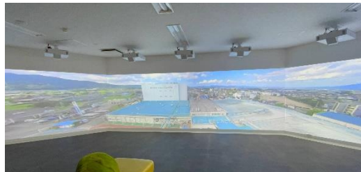
270度の視野で体感できる「スクリーンT」

360度カメラで撮影した製造過程の映像を6つのプロジェクターを使用し、壁に投影することで、まるで加工場に入ったような感覚を体験できます。鳥栖工場では製造していないベビーフードの製造過程も没入感のある映像を通して紹介し、安全安心な商品づくりの仕組みを伝えています。