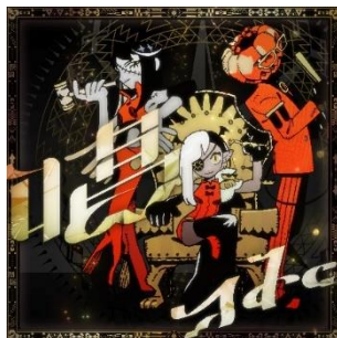
唱 / Ado 配信日：4月25日（木）