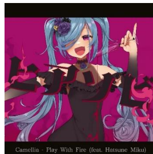
ヒアソビ / かめりあ 配信日：4月25日（木）

Ado「唱」 Licensed by Virgin Music, A UNIVERSAL MUSIC COMPANY