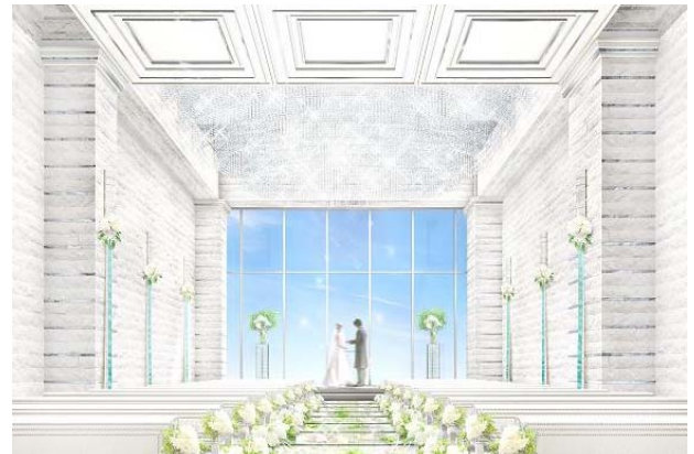
チャペル「Crystal Sky Chapel」