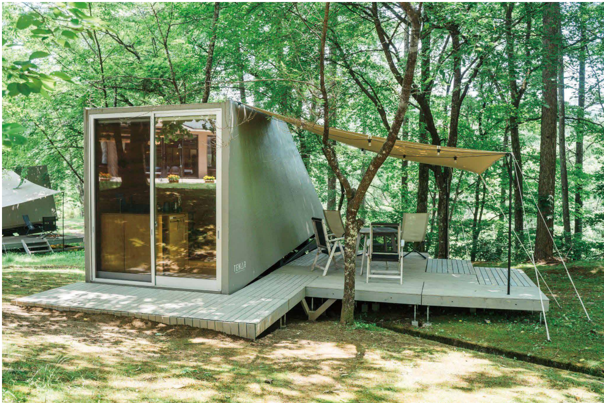
オーナー募集対象③ :中古・寝室棟「TENAR001」 設置場所:長野県安曇野市 ¥5,810,000-(税込)