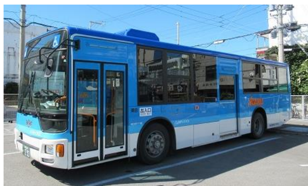
【東運輸が運行する路線バス】