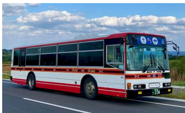
【カーリー観光が運行する路線バス】