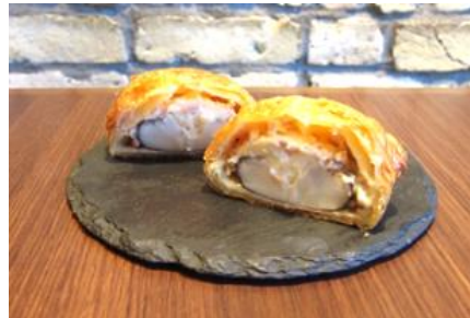
「黒鐘椎茸と生ハムのパイ包み」