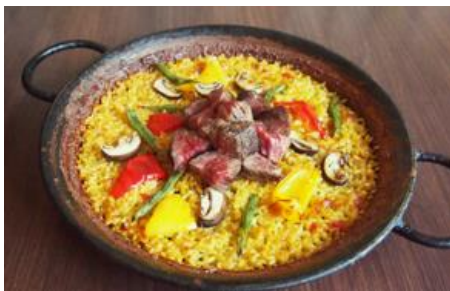
「熊本県産 赤牛ステーキのパエリア」