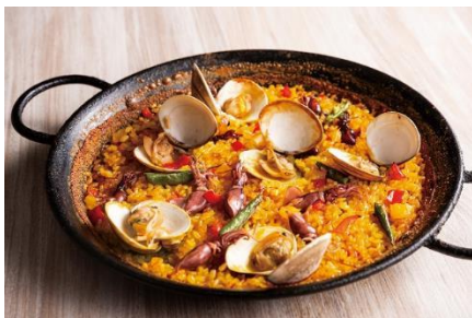
「ハマグリとホタルイカのパエリア」

本イベントでは、濃厚な魚介だしで炊き上げたRico自慢のパエリアや、スペイン・カタルーニャ地方の牛肉の赤ワイン煮込み“フリカンド”などを販売。さらに、熊本県産赤牛「延寿牛」を贅沢に使用したパエリアや、大きく肉厚で、上品な香りが特徴の「黒鐘椎茸」を使用したパイ包みなど、今回限定の特別メニューも取り揃えています。