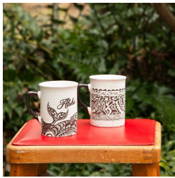
チャリティ対象商品に5月発売の新商品が加わります