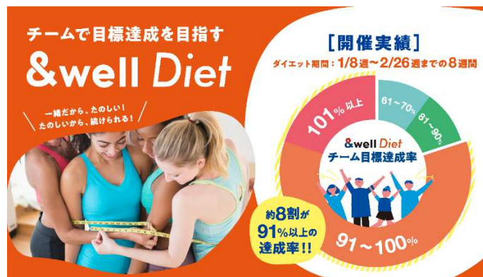
チームで目標達成を目指す「&well Diet」

また、初の取り組みとしてチーム参加型のダイエット企画「&well Diet」を実施。&well の特色となる「チームで楽しむ」ことを意識した本企画には参加枠を超えるたくさんの申込がありました。特定の健康課題を 1 人ではなく、チームで楽しんで解決する本企画を 2024 年度の重点施策として、禁煙や睡眠など様々な切り口で実施予定です。