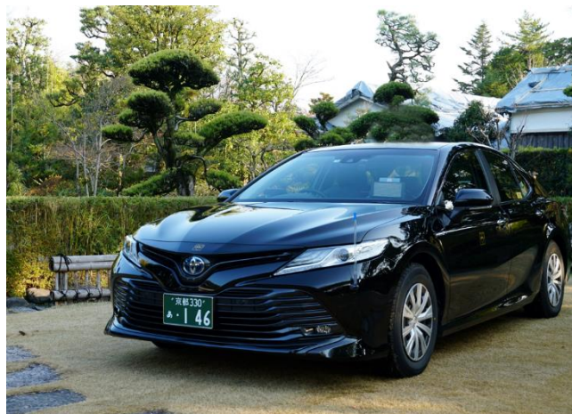
写真は全て 5 周年記念プラン/イメージ

変なホテル京都 八条口駅前、開業 5 周年を記念して、京都の老舗ハイヤー、エムケイグループの MK ハイヤー5 時間の貸切と京都の厳選土産 7 種類付きプランを 3 月 29 日（金）に発売します。MK ハイヤー5 時間の貸切は、ホテルからご乗車いただき、お客様のご要望にあわせて 5 時間の観光にご案内します。降車場所は次のご予定に合わせて自由に設定が可能です。観光案内ができるドライバーが、京都の老舗ハイヤーならではのサービスをご提供します。また、京都の厳選土産は、江崎グリコの地元ポッキー〈宇治抹茶〉、京都菓子工房イチハナダツテの九条ネギと海老のおこげはんとカレーうどん 風おせんべい 錦小路つる乃、ネスレ日本株式会社のキットカット ミニ 伊藤久右衛門 宇治抹茶、よーじやのあぶらとり紙などの 7 種類をご用意します。宿泊期間は 4 月 15 日（月）～9 月 30 日（月）の期間限定で、価格は 48,500 円～（1 室、素泊まり、税サ込）。