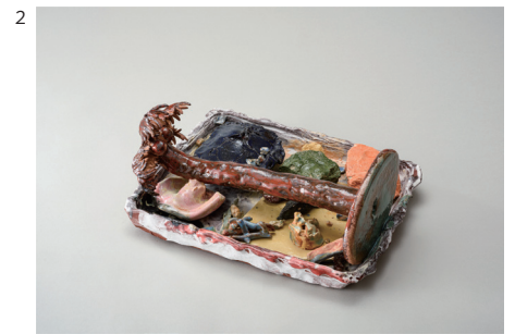
2 梅津庸一 《幻視》2021年 陶 舛居蔵