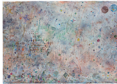
梅津庸一 《集団意識》2021年 紙に水彩、インク、アクリル、油彩、エナメル みそにこみおでん蔵

梅津はあらゆるものをその身に引き受け、総合しようと企てます。過去と現在、産業と芸術、プロとアマ、「美学と政治」といった線引きを曖昧にしていくことが、その主たる狙い입니다。もちろん、本展覧会においてもその姿勢は一貫しており、だからこそ彼は、何らかの物語や型にはめこもうとする美術館側の意図に抵抗を示すはずでなく、むしろ逆に、彼はここ国立国際美術館の姿を、別様に浮かび上がらせようとするでしょう。1970年に開催された大阪万博、そこにルーツを持つ当館に、彼は「クリスタルパレス」という、新たな概念でもって紹介しようと試みます。