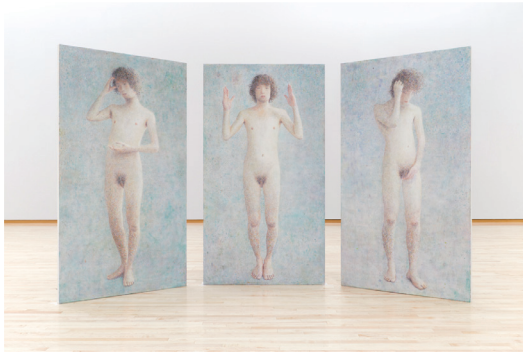
梅津庸一 《智・感・情・A》2012-14年 布、パネルに油彩 東京都現代美術館蔵