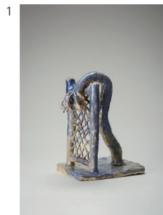
1 梅津庸一 《フェンスにもたれかかるバームツリー》2021年 陶 作家蔵

2021年春、梅津は滋賀県に位置する六古窯のひとつ、信楽へと移住します。長引くコロナ禍の閉塞感に疲れ、さらには現代美術という領域そのものへの不信を募らせていた当時の梅津には、作陶によって、いまいちど制作する意欲を取り戻すための時間が必要でした。手探りで進められるその不慣れた制作は、まさにリハビリと呼ぶに相応しいでしょう。かつて絵画において取り上げていた主題を、今度は陶芸へと轉移させ、また陶芸を手がけるように絵画をつくる、そんな相乗効果も確認できるはずです。