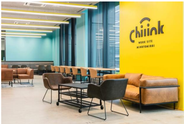
< coworking space >

『chilink WORKSITE MINATOMIRAI（チリンク ワークサイト みなとみらい）』は、京急電鉄、ATOMica等の連携によって誕生した、オープンノベーション創出拠点。『chilink』には、人それぞれのペースで作業したり、またゆっくり休んだり「chill」も楽しみながら、人や機会と繋がっていただきたい、という想いが込められています。「行きたくなくて居たくなる」ような、居心地の良い繋がれるワークスペースを目指します。ひいては、みなとみらいを盛り上げるイノベーション拠点として、間口は広く、多様な人を受け入れたコミュニティづくりを後押しします。