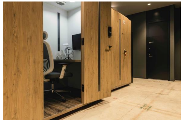
< telephoning booth >