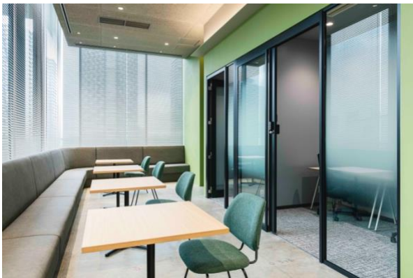
< coworking space >