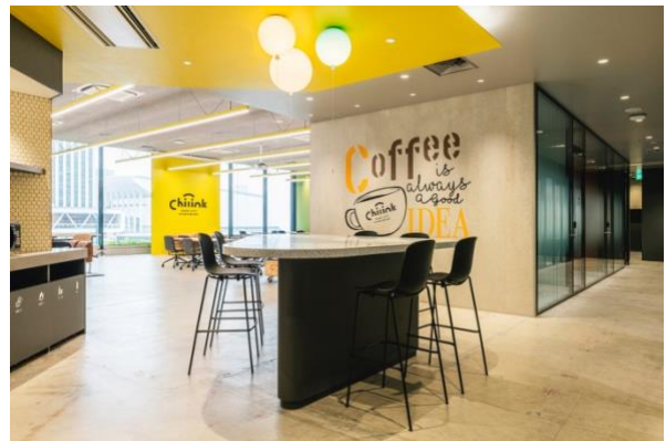
< coworking space >