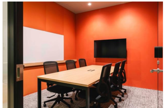
< meeting room >