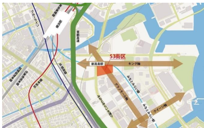
みなとみらいの都市軸の交点に立地

※2 CASBEE 横浜・・・CASBEE（建築環境総合性能評価システム）で定める評価基準に加え、横浜市の地域性や政策等を勘案して評価基準を修正した、より地域の実態を反映した環境配慮制度。