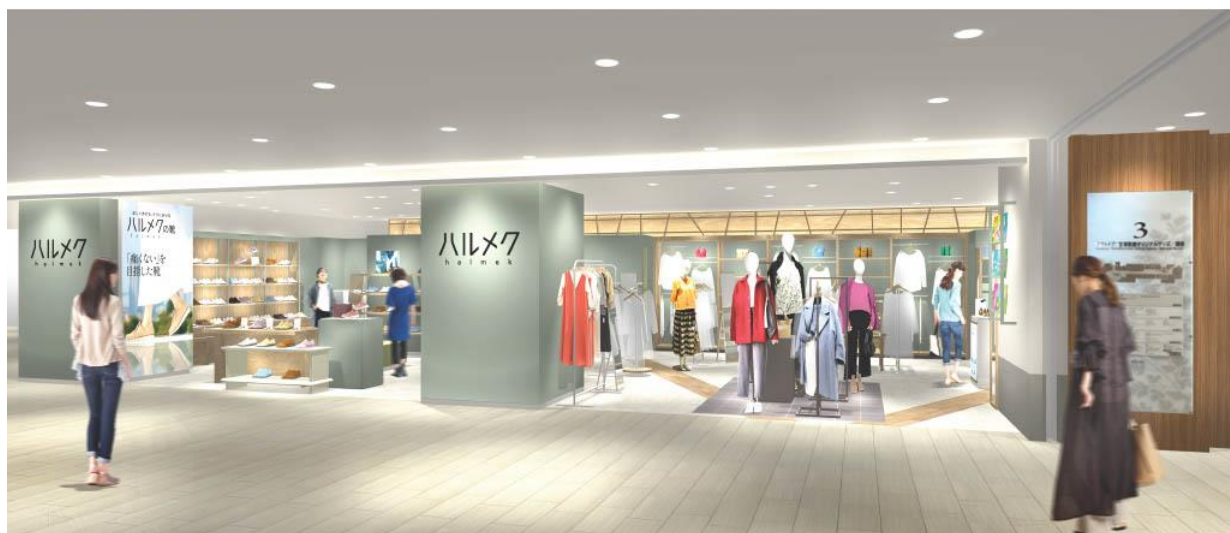
※写真は店舗イメージ

雑誌「ハルメク」と一緒にお届けする通販カタログ「ハルメク おしゃれ」「ハルメク 健康と暮らし」で販売している商品を扱うハルメク おみせ。50代以上の女性のために開発したオリジナルのファッションアイテムやコスメ、下着などさまざまな商品を購入いただけます。