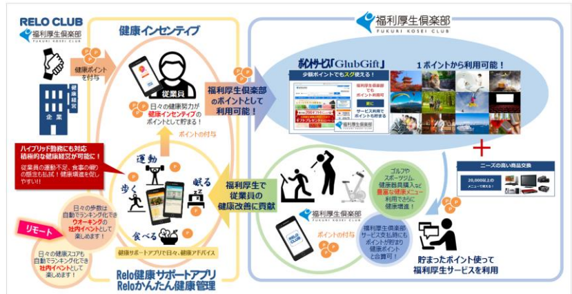
▲「Relo健康サポートアプリ」「健康インセンティブ」などを活用した健康ポジティブサイクルの確立

健康経営や健康増進管理にご興味・悩みがある担当者の方へは、 健康経営アドバイザー ※2 が具体的な成功例を交えてお悩みのご相談を承り、従業員の健康増進、エンゲージメントを高めるお手伝いをいたします。健康経営アドバイザーに直接相談できるまたとないチャンスなので、お気軽にブースへお立ち寄りください。