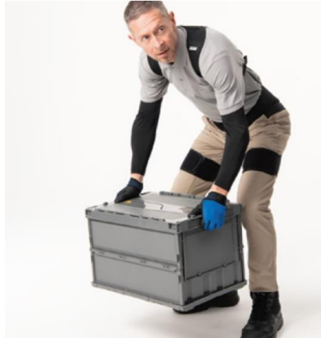
▲持ち上げ姿勢をサポート