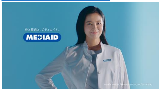
▲MEDIAID ブランドアンバサダー 黒谷友香さん

医療現場で求められる機能・品質はそのままに、様々な仕事のシーン、普段の生活シーンでの着用感・快適性を追求した素材選び・ものづくりから、すべての製品を生み出しています。