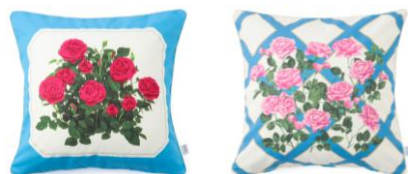
【商品名】ルル メリー クッションカバー 【種類】バラ レッド/バラ 【価格】各 ¥3,500

左：ショコラサブレのパッケージデザインを落とし込んだクッションカバーです。鮮やかなブルーとバラのコントラストがモダンな印象を引き立てます。周囲に施したロープパイピングが繊細で上品なアイテムです。