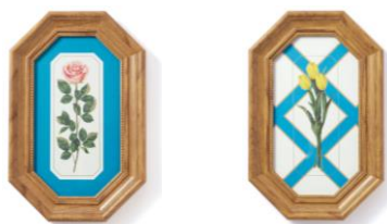
【商品名】ルル メリー アートボード 【種類】バラ ピンク/チューリップ 【価格】各 ¥3,000