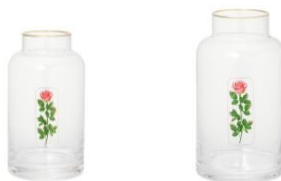
【商品名】ルル メリー バラ ピンク フラワーベース S 【価格】 ¥2,500 【商品名】ルル メリー バラ ピンク フラワーベース M 【価格】 ¥3,500

曲線が美しいクリアベースにルル メリーのバラとゴールドリムのデザインがモダンさを感じるフラワーベースです。お花を飾ってテーブルコーディネートがすれば、より豊かで幸せなティータイムを楽しめます。