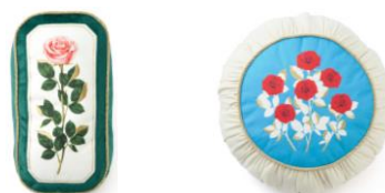
【商品名】ルル メリー クッション 【種類】バラ ピンク/バラ 【価格】各 ¥4,200

右：レモンサブレのパッケージデザインを落とし込んだクッションカバーです。爽やかなブルーの格子柄とバラのピンクの掛け合わせにゴールドの細いロープパイピングがアクセントになった上品なアイテムです。