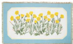
【商品名】ルル メリー スロー 【種類】バラ ピンク/ミヤマキンポウゲ 【価格】各¥8,800

モダンでキャッチーなルル メリーのパッケージデザインをクラシカルなジャガード織りで仕上げたインパクトのあるスローです。1枚でブランドの世界観を表現しています。ソファやベッドとコーディネートするのはもちろん、タペストリーとしてアートのように壁に飾っても楽しめます。