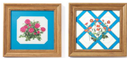
【商品名】ルル メリー アートボード 【種類】バラ レッド/ペニバナダイコンソウ 【価格】各 ¥3,000

ナチュラル調のフレームにルル メリーのアートとブルーのアクセントカラーが映えるアートボードです。ダイニングシーンはもちろん、リビングやベッドルームなど、お部屋のアクセントになるアイテムです。八角形と四角形をラインアップし、コーディネートが楽しめます。