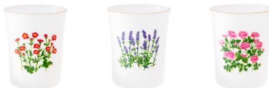
【商品名】ルル メリー フロストタンブラー 【種類】ベニバナダイコンソウ/ラベンダー/バラ 【価格】各 ¥1,400

レモンサブレのパッケージデザインを落とし込んだフロストタンブラーです。曇りガラスとゴールドリムが上品で高級感のあるティータイムを演出します。セラミックシリーズと一緒にコーディネートを楽しめます。