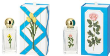
【商品名】ルル メリー ルームフレグランススプレー 【種類】チューリップ/バラ ピンク 【価格】各¥3,600

ルル メリーのレモンサブレとショコラサブレのパッケージデザインをイメージしたルームフレグランススプレーです。エッセンシャルオイルを使用し、ナチュラルなチューリップとローズの本格的な香りを楽しめます。クラシカルな形のガラス瓶やゴールドのキャップが印象的な、上質で存在感のあるアイテムです。