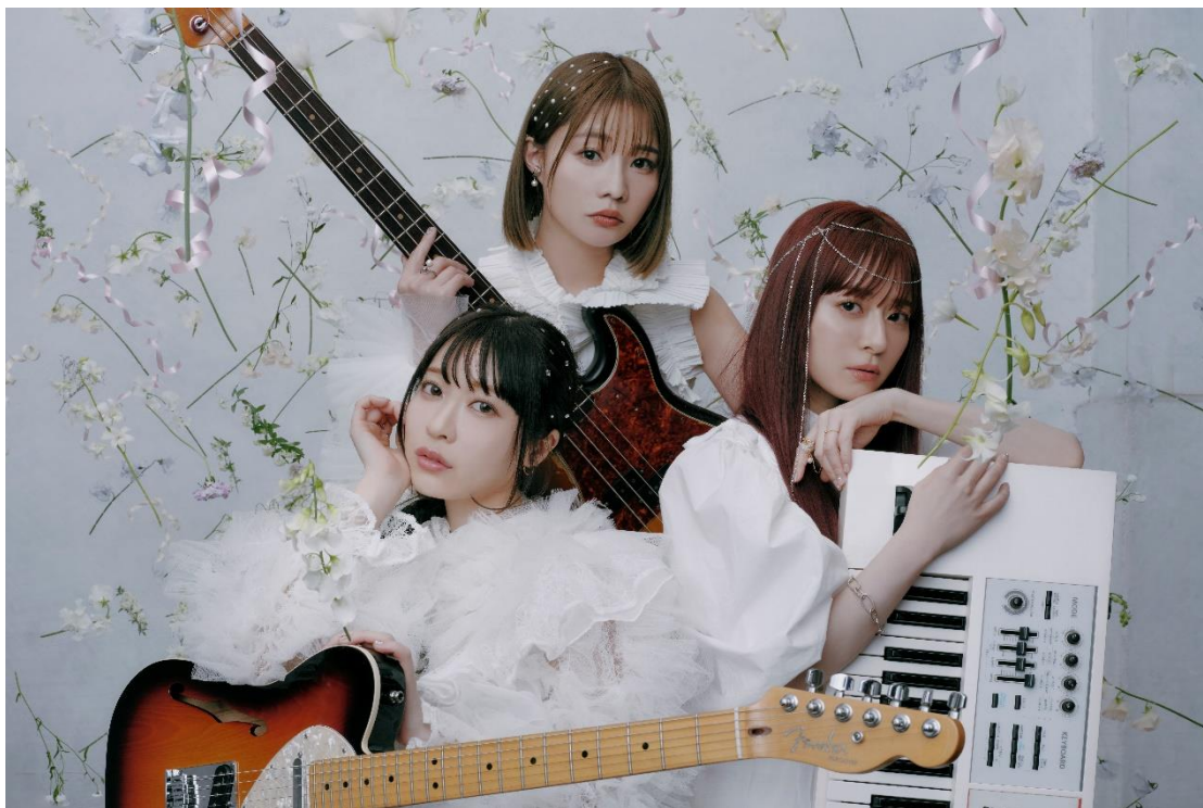
Vo&G.すう(吉田董)、Ba.山内あいな、Key.黒坂優香子の3名からなる ガールズバンド「SILENT SIREN」(サイレントサイレン)。

2012年11月、シングル「Sweet Pop!」でメジャーデビュー。通称“サイサイ”として親しまれ、原宿を中心に女子中高生に人気ที่広がり、LINE公式アカウントの登録者は56万人を超える。