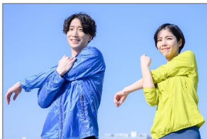
運動後のリフレッシュに