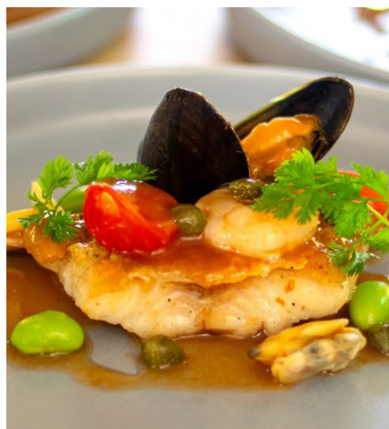
姫鯛のアクアパッツァ

またbuffetコーナーには「厚切りベーコンとポテトのソテー リヨン風」や「牛肉とマジョラムソーセージのポトフ」に「日替わりパスタ」をはじめ、朝食でも人気の「チーズフォンデュ」もお楽しみいただけるほか、パティシエ特製の日替わりスイーツなど、約30種類の料理をご用意しております。ちょっと贅沢なランチタイムを是非お楽しみください。