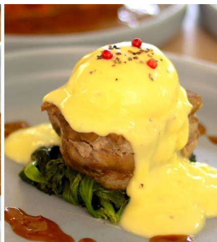
阿蘇自然豚のベネディクト風