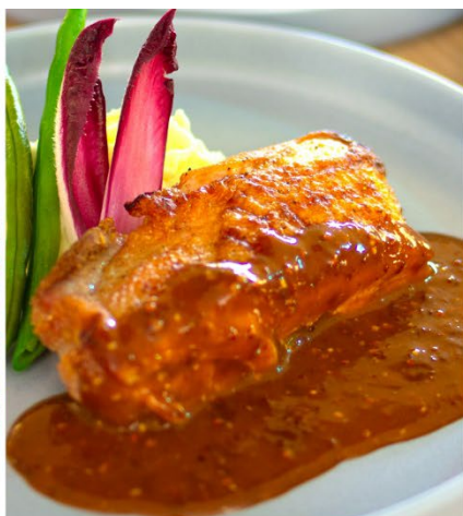
九州産若鶏のグリル ハニーマスタードソース