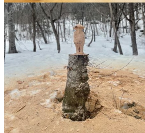
「山のかたち、森のかたち」展示風景他