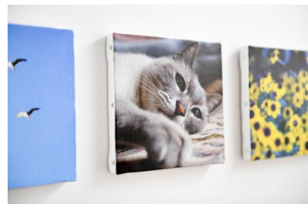
WALL DECOR (172mm×172mm)

※4 特別価格は、作品応募と同時に「WALL DECOR」をご注文いただいた場合に限り ます。