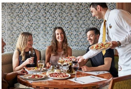
アルフレッド・ピッツェリア