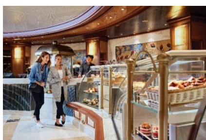
インターナショナル・カフェ