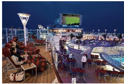
ムービーズ・アンダー・ザ・スターズ