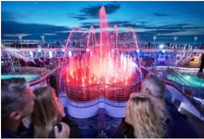
プリンセス・ウォーターカラー・ ファンタジー・ショー

プリンセス・ウォーターカラー・ファンタジー・ショーは、音楽に合わせて10メートルの高さまで上がる噴水とイルミネーションが繰り広げられる魅力的なプログラムです。ムービーズ・アンダー・ザ・スターズは、69,000ワットの音響システムと28㎡以上のスクリーンを備えた屋外シアターで、映画、コンサート、スポーツイベントなどをお楽しみいただけます。プリンセス・シアターでは、受賞歴のあるラスベガス・スタイルのプロダクション・ショーをはじめとする華やかなプログラムを上演します。