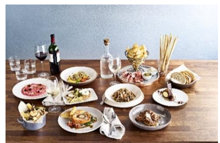
サバティエーニ・イタリアン・トラットリア