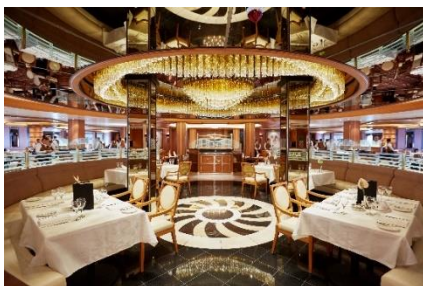
コンチェルト・ダイニング

クラウン・グリル - 落ち着いた雰囲気の内装とシアタースタイルのキッチンを備えたアメリカン・スタイルのステーキハウスでは、ロブスターやプレミアム熟成ビーフなどこだわりのメニューの数々をご用意しています。