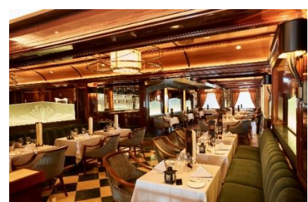
クラウン・グリル