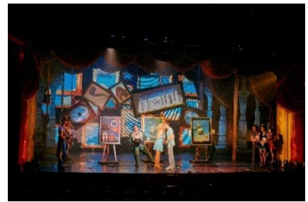
プリンセス・シアター