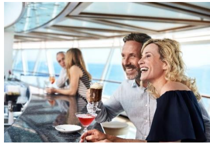
シー・ビュー・バー