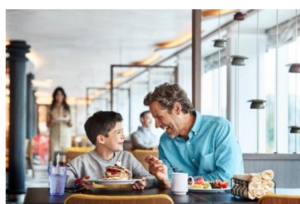
ワールド・フレッシュ・マーケットプレイス