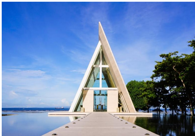
&lt;インフィニティチャペル 外観&gt;