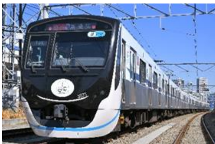
▲すでに運行している3020系ラッピングトレイン