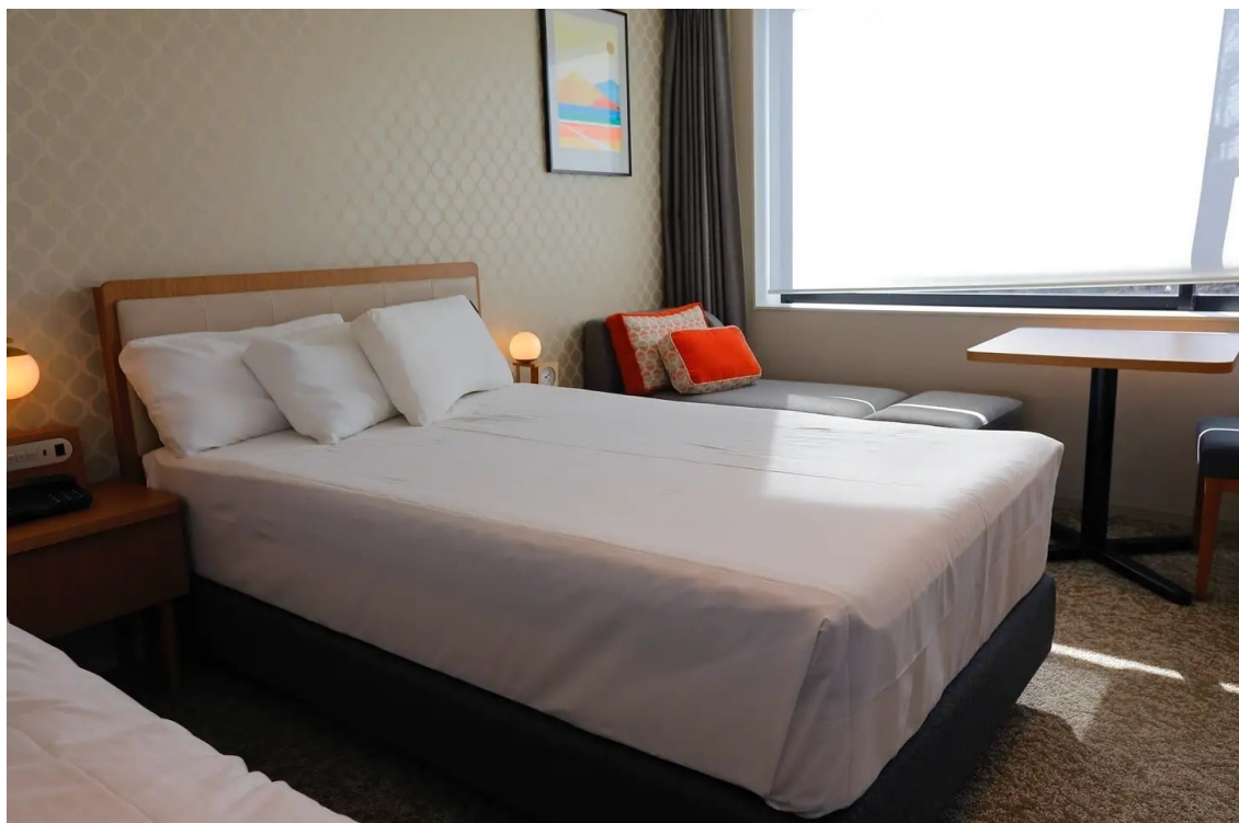
実際の宿泊部屋イメージ